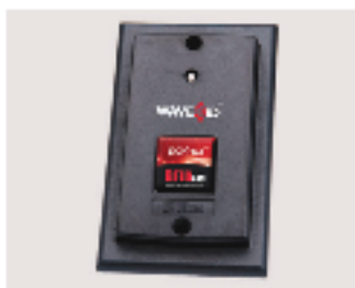
壁取り付け用リーダー