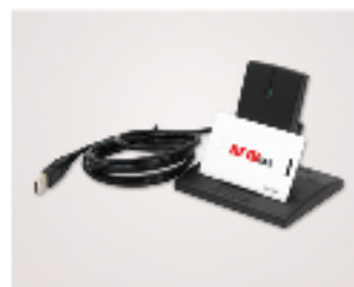
デスクトップ用リーダー