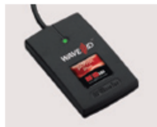
pcProxプラス82シリーズ デスクトップリーダー